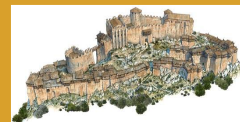
Le château de Montségur, reconstitution (Loïc Derrien, aquarelle)